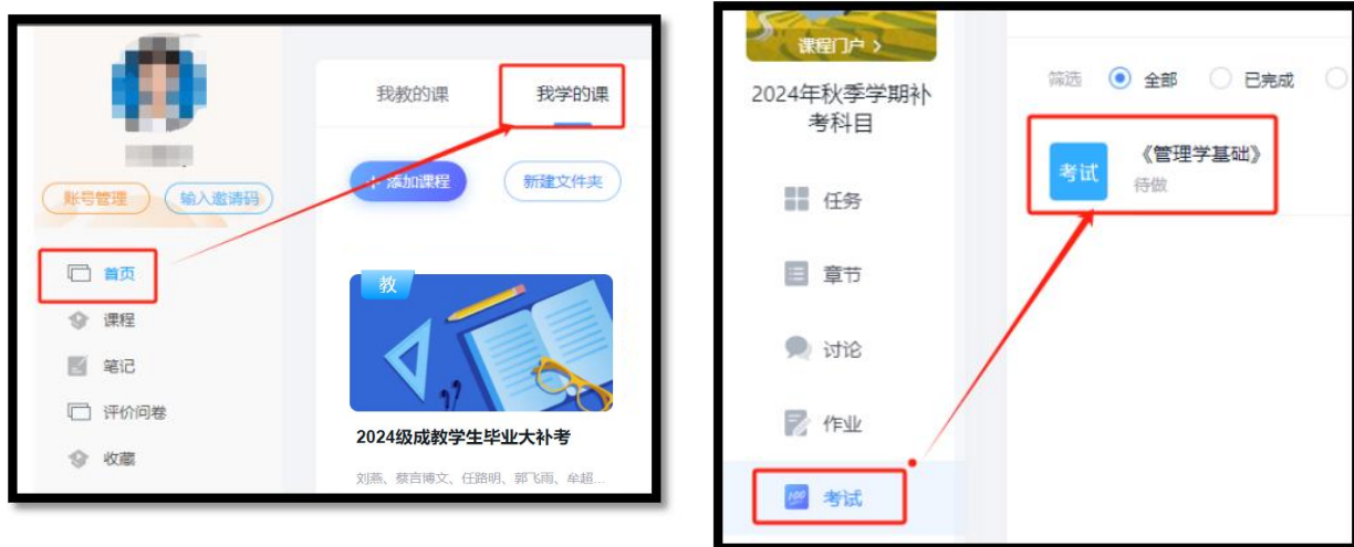
图1 电脑端补考操作流程

登录学习通平台→依次点击“我”→课程→我学的课，进入2024级成教学生毕业大补考→点击作业/考试→选择考试→找到对应的补考试卷参加考试即可。